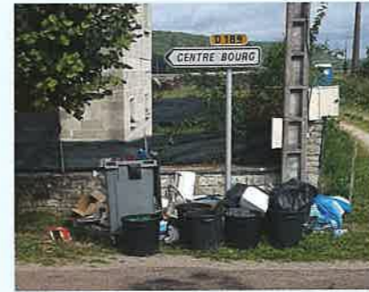
Les bacs devant la maison, c'est fini !

Avec des bords de route et trottoirs exempts de bacs et de déchets, la mise en place de points de collecte de proximité participe à un environnement plus propre et à un embellissement de nos communes et villages.